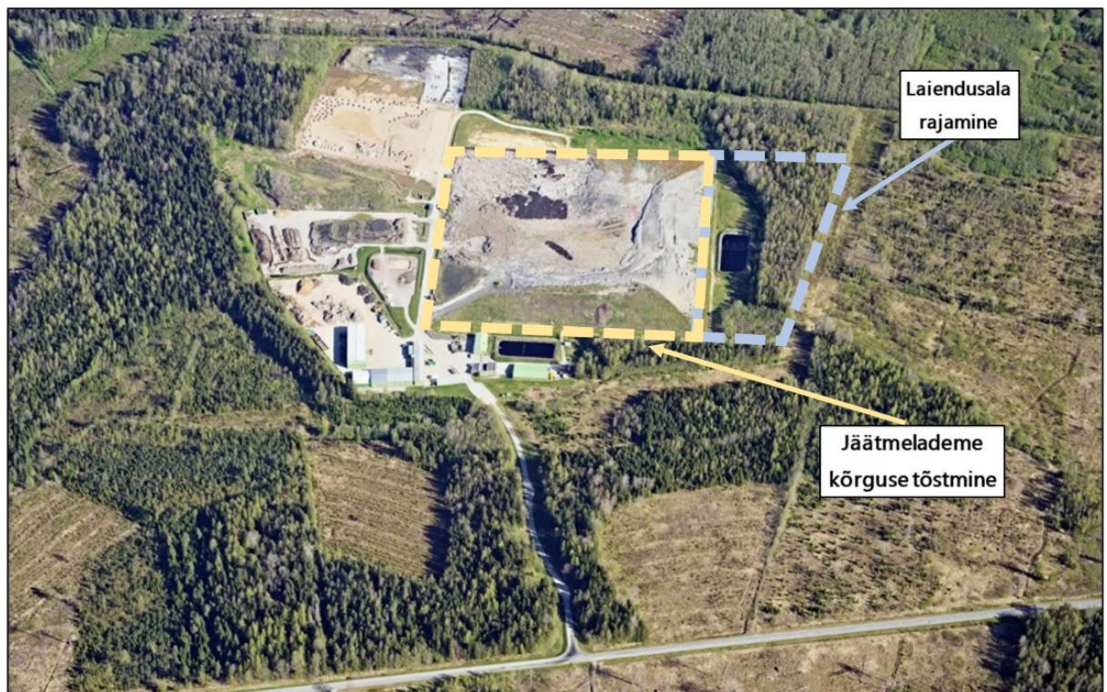
Joonis 2. Vaade Väätsa prügilale ja lähiümbrusele